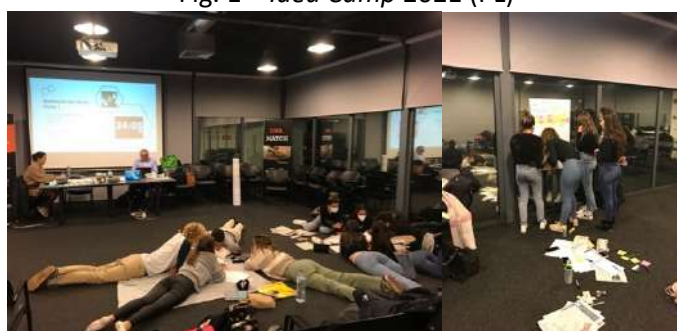
Fig. 1 – Idea Camp 2021 (PL)