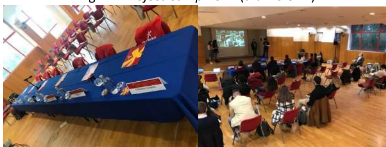
Fig. 2 – Project Camp 2021 (diurno e PL)