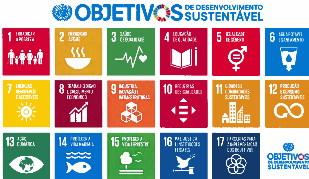
Fig. 1 – ODS definidos na Agenda 2030.

São 17 os ODS que compõem a resolução da Organização das Nações Unidas (ONU) intitulada “Transformar o nosso mundo: Agenda 2030 de Desenvolvimento Sustentável” (Fig. 1). Os ODS definidos representam um contrato social entre os líderes mundiais e os povos, visando resolver as necessidades das pessoas, tanto nos países desenvolvidos como nos países em desenvolvimento.