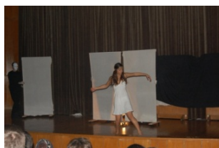
Artes e Espetáculos