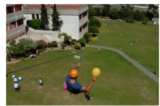
Desporto e Turismo Aventura