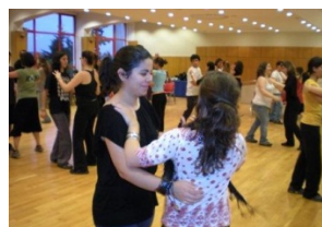
Animação Desportiva 2