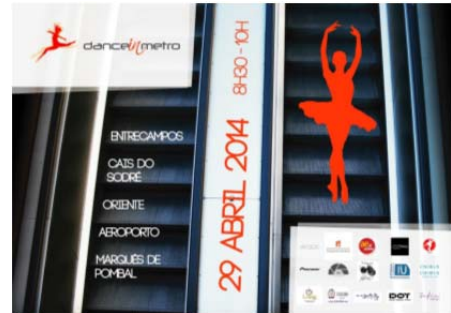
Dance in Metro 23º Aniversário da ESHTe