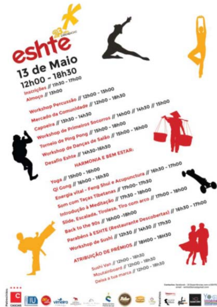
23º Aniversário da ESHTe