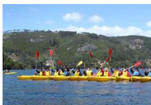
Animação Desportiva 1