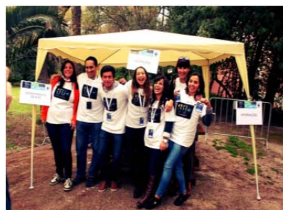
Hora do planeta