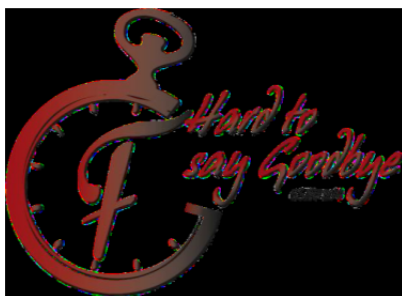
Gala de finalistas