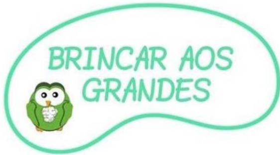
Brincar aos grandes