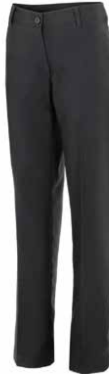
CALÇA CLÁSSICA PARA MULHER

34 / 36 / 38 / 40 / 42 / 44 / 46 / 48 / 50