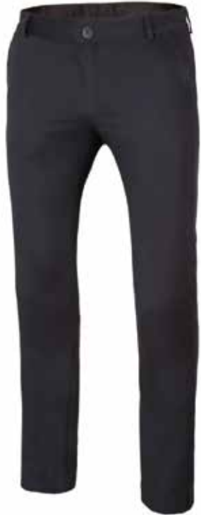
CALÇAS CHINO STRETCH PARA MULHER

Fecho-ecler central e botão Costura traseira de segurança Pinças traseiras Tecido elástico e anti-rugas 2 bolsos franceses 2 bolsos traseiros de vivo decorativos