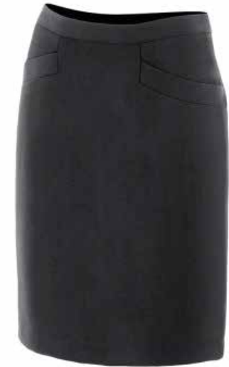
SAIA COM FORRO

Fecho-ecler traseiro e botão Cós reforçado com entretela Pinças traseiras Abertura inferior na parte traseira Tecido anti-rugas 2 bolsos de vivo em costura